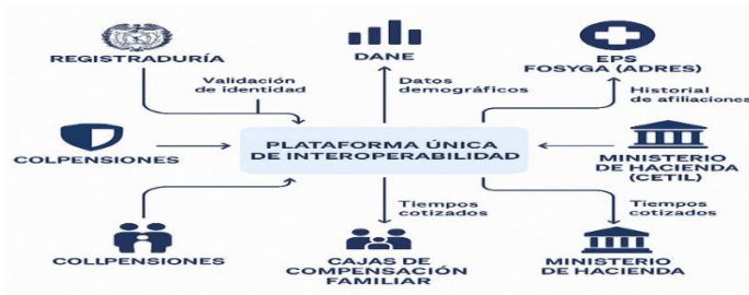
Figura 2. Marco de Interoperabilidad del Estado Colombiano para el Gobierno Digital