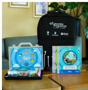
Ilustración 3: Kit Biobots

Esta solución posiciona a Biobots como una herramienta educativa accesible y relevante, capaz de transformar la enseñanza del pensamiento computacional en contextos rurales, creando un impacto significativo en la educación STEM.