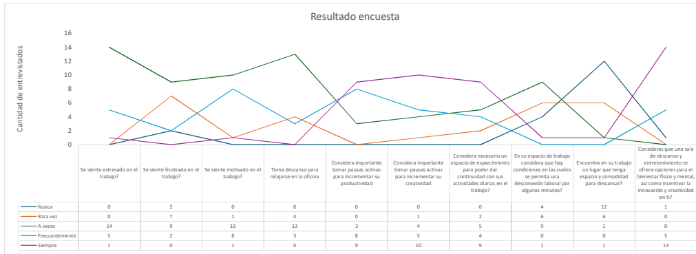
Imagen 1. Gráfico lineal. Resultado encuesta, elaboración propia de los autores.