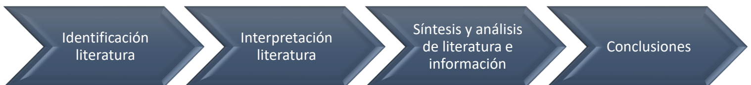
FIGURA 2. METODOLOGÍA REVISIÓN LITERATURA.

Para la revisión de literatura del presente trabajo se adopta la metodología presentada y resumida en la Figura 2 .