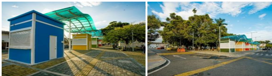
Figura 4. Kioskos en el Parque Principal- sin muralismo

Nota. El muralismo es la transformación y revitalización de espacios urbanos, la expresión de identidad cultural e historia, el fomento de la creatividad y la cohesión social.