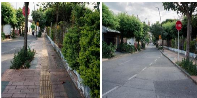
Figura 3. Carrera 6 entre calles 5 y 6 del Municipio de Bugalagrande

Nota. La carrera 6 entre calles 5 y 6 se caracteriza por sus andenes con guía podotactil, diversidad de jardines que se mezclan con la arquitectura tradicional y moderna.