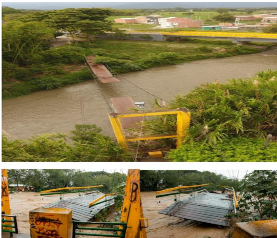
Figura 1. Puente Colgante Sobre el Río Bugalagrande

Nota. Puente Colgante de piso de madera sobre el Río Bugalagrande. Este puente une los Barrios: 1° de Mayo, El Edén, y las veredas de Mestizal, Guayabo y San Antonio que han sido separados por el río.