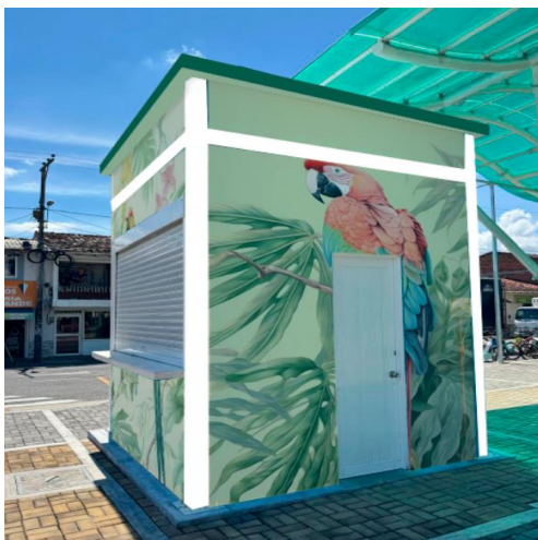
Figura 5. Propuesta muralismo en kioskos en el parque principal y en el corredor de las aves