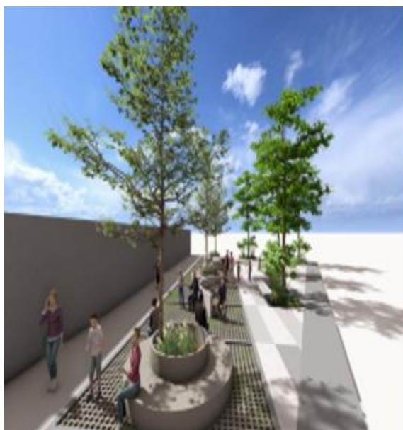
Figura 7 Propuesta parque de los Chivos

Nota. Mejorar un puente colgante beneficia la conectividad, la economía, fomentando el turismo por los diferentes corredores viales.