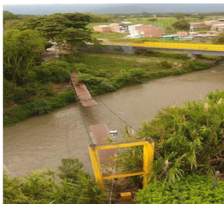
Figura 6. Propuesta puente colgante sobre el rio Bugalagrande

Estos murales buscan educar sobre la importancia de la biodiversidad y la protección de las especies, al mismo tiempo que reflejan la profunda conexión cultural y simbólica del ser humano con las aves, como representación de libertad y espiritualidad.