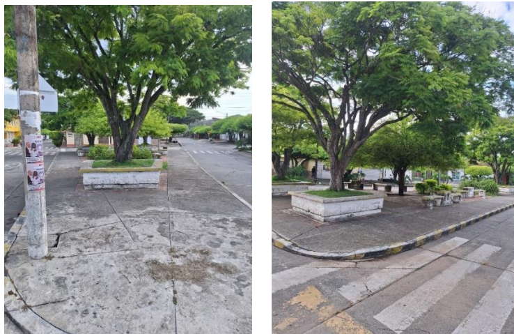
Figura 2. Parque los Chivos Bugalagrande

Nota. El parque de los Chivos es representativo por ser un cruce vial con andenes podactiles y arboles nativos de la región