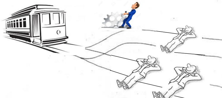
Figura 4. El problema del Trolley.

Con las anteriores limitaciones, en la investigación se planeará un dilema ético asociado al desarrollo de proyectos E.H.Y.N.C. pretendiendo identificar sus implicaciones morales. Se explicará el dilema con el clásico “Problema del trolley”. (Figura 4) : ¿Qué es más ético, desarrollar hoy proyectos E.H.Y.N.C. que pueden tener potenciales afectaciones negativas a nivel socio-ambiental para más de 800.000 personas o no desarrollar proyectos E.H.Y.N.C hoy que pueden tener potenciales económicos para más de 48 millones de colombianos a nivel de sostenibilidad fiscal?. Por otra parte, ¿Es la afectación de poca vista por muchos, comparable con la afectación de muchos vista por pocos?