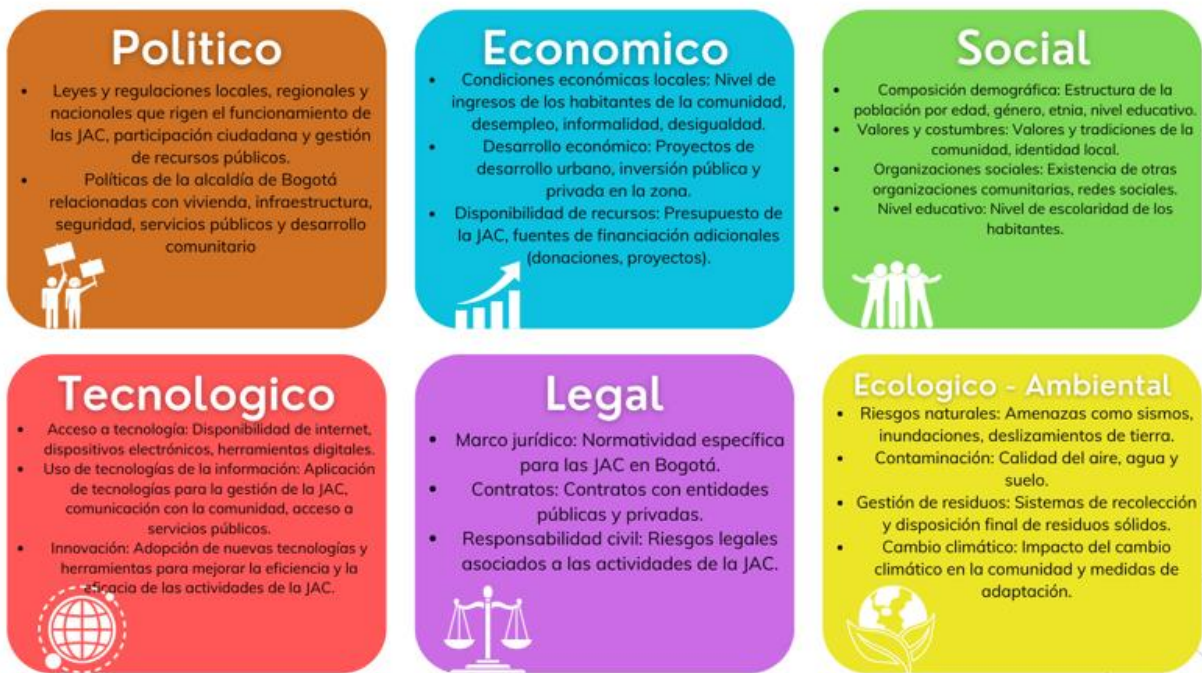
Figura 4: Análisis Pestel Junta de Acción Comunal Prado Veraniego.