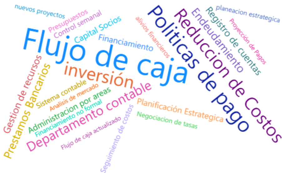
Grafico nube de palabras estrategias financieras usadas por las Pymes, elaboración propia