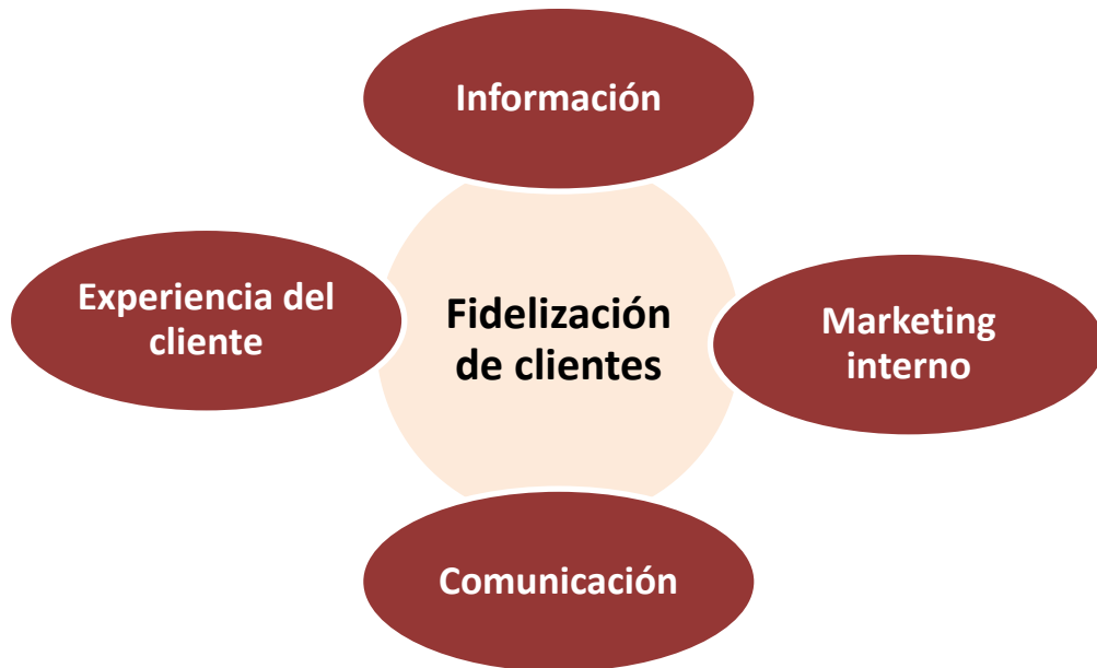
Ilustración 2. Dimensiones de fidelización de clientes.