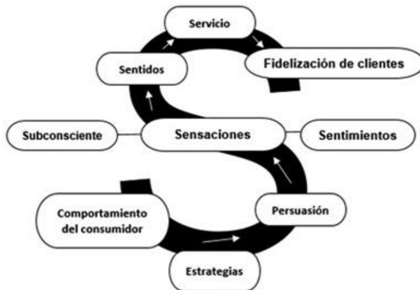
Ilustración 4. Modelo de mecanismos sensoriales de las tres "S" (M3S).