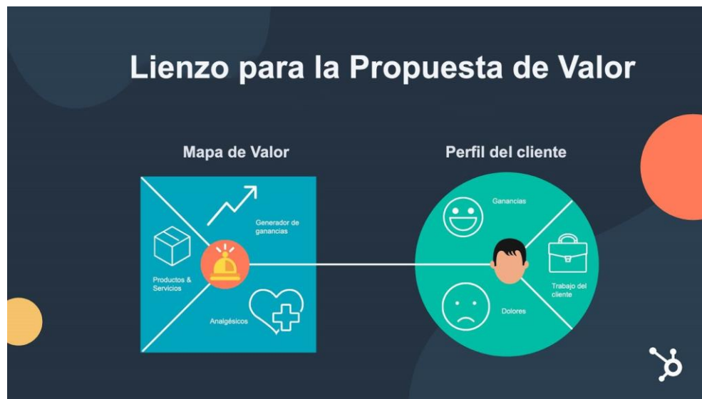
Ilustración 6. Esquema de lienzo de la propuesta de valor.