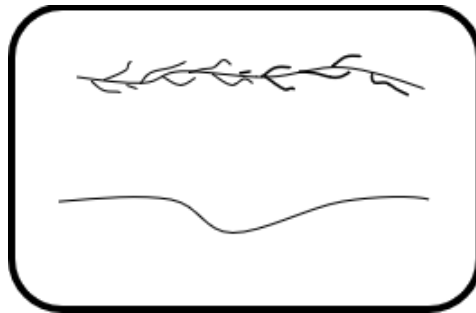
Ilustración 1 Estructura de los polimeros termoplásticos.

(Figura I), que cuenta con la particularidad de estar de forma bifurcada o no. Dentro de esta categoría encontramos materiales que se agrupan en este tipo: Polietileno (PE), poliestireno (PS), cloruro de polivinilo (PVC) y polipropileno (PP).