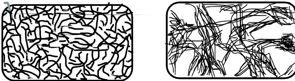
Ilustración 2 Estructura de s termoplásticos amorfa y cristalina.

Los termoplásticos. son un tipo de polímeros que se caracterizan por su capacidad de ser moldeados repetidamente mediante la aplicación de calor y presión, conservando las propiedades mecánicas y químicas después de múltiples ciclos de moldeo. Asimismo, se subdivide en una amplia variedad de categorías debido a sus propiedades únicas, como la resistencia a la deformación, la durabilidad, la resistencia química y la facilidad de moldeo, por ejemplo, el polietileno (PE), el policarbonato (PC), el polipropileno (PP), el politetrafluoroetileno (PTFE) y el polimetacrilato de metilo (PMMA o acrílico).