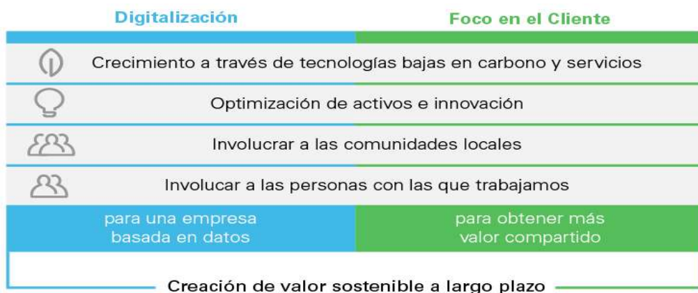
Lineamientos del Plan de sostenibilidad Grupo Enel 2018-2020

Nota. Adaptado de Lineamientos del Plan de sostenibilidad Grupo Enel 2018-2020, Enel S.A (2018), Plan de sostenibilidad ambiental | Enel Colombia.