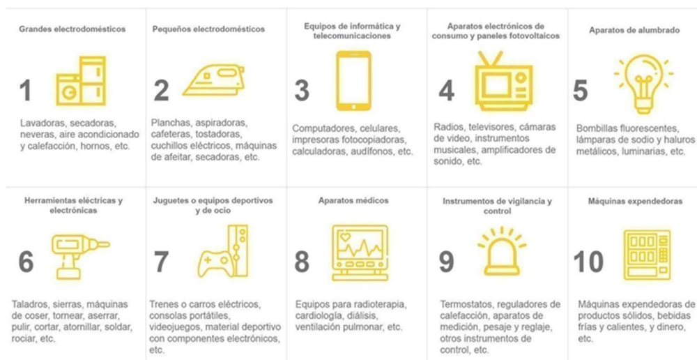
Gráfico 3. Categorización de los aparatos eléctricos y electrónicos.

Nota. Adaptado de Categorización de los aparatos eléctricos y electrónicos, Perez Molano O, (2021), Comunicaciones y Relaciones Públicas UPB https://www.upb.edu.co/es/central-blogs/sostenibilidad/reciclar-residuos-electronicos-y-electricos-raee