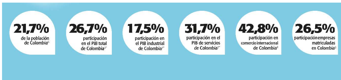
Bogotá Región es el motor de Colombia

Nota. Adaptado de Bogotá Región es el motor de Colombia, (2022), Invest In Bogotá – DANE https://es.investinbogota.org/por-que-bogota/datos-generales-y-cifras-de-bogota/