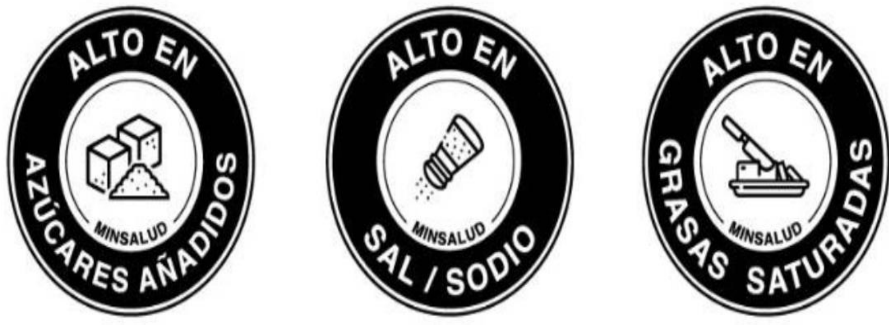
Figura 1. Sellos de Advertencia para empaque de Colombia