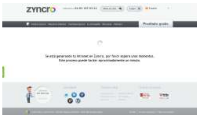
Figura 1. Creación de Red corporativa en Zyncro

Para esto, se seleccionó Zyncro, una herramienta de red social corporativa, la cual cualquier Pyme puede acceder y que es gratis hasta 5 usuarios e incluso puede adquirirse con un valor bajo por usuario. En esta modalidad la personalización de la herramienta, el acceso y las interacciones son muy sencillas y cualquier persona con conocimientos básicos de funcionamiento de un portal como Facebook puede entrar e interactuar de manera rápida. El software de Zyncro usado en esta prueba es una aplicación en la nube, que puede accederse desde el computador o dispositivos móviles tipo celulares y tabletas. La creación de su propia red social corporativa es simple. Ingrese a http://www.zyncro.com/ y cree su usuario y contraseña, y el tipo de producto que desea. En este caso, para propósitos investigativos, se creó con una licencia gratuita limitada a 5 usuarios. Siempre que se desee volver a ingresar a su red, podrá realizarlo desde la página web sobre el link de Log In.