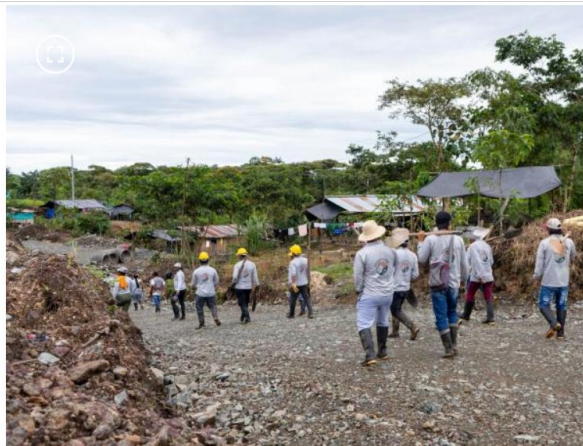
Mingüeros durante la obra de la primera fase del Toar en el territorio del sur de Nariño.