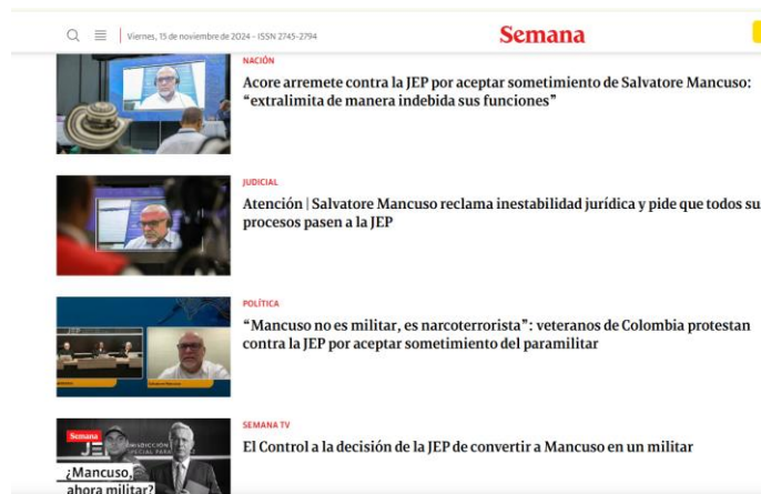
Imagen 2. (Semana, 2024)

Un ejemplo significativo al respecto es el cubrimiento mediático de las audiencias que mantuvo el exjefe paramilitar, Salvatore Mancuso, en la JEP. Estas diligencias fueron altamente cubiertas por los medios de comunicación, publicando una nota periodística de cada una de las afirmaciones que el compareciente decía en audiencia. Con entradillas sensacionalistas, los medios lograron colarse en el imaginario de sus lectores, sembrando una idea de que la impunidad y libertad de Salvatore podría estar en manos de la JEP.