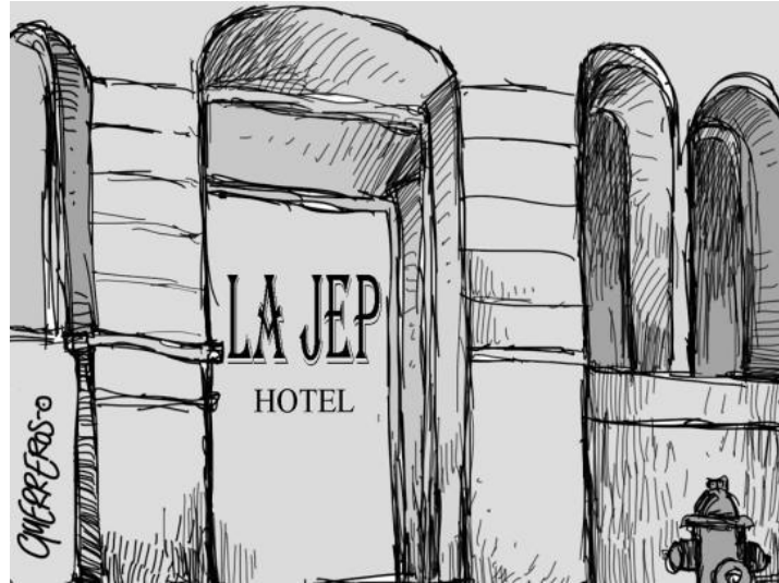
Imagen 1. (Guerreros, 2024)

En contra de esa percepción pública, para la JEP la centralidad son las víctimas, pues según la Magistrada de la Sala de Reconocimiento de Verdad y Responsabilidad (SRVR), Belkis Izquierdo Torres, ante la Cátedra UNESCO (2023), el diálogo y la coordinación interjurisdiccional son fundamentales para reconocer la contribución de las autoridades étnicas y víctimas en la instrucción de los Macrocasos para el esclarecimiento de la verdad, pues proporcionan perspectivas únicas sobre el territorio y su relación inescindible con los diversos sistemas de vida, la dinámica del conflicto armado y las posibles formas de reparación y sanación.