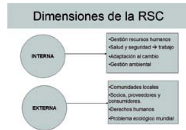
Gráfica 8. Dimensiones de la responsabilidad social