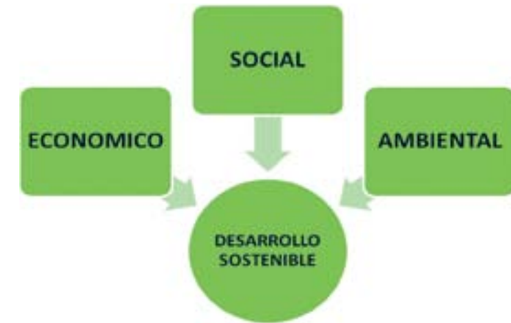
Gráfica 6. Dimensiones del desarrollo sostenible