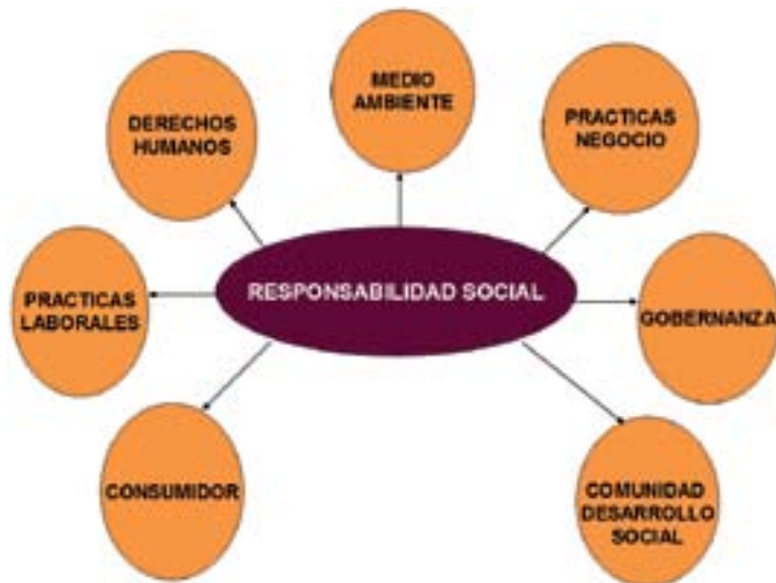
Gráfica 7. Temas centrales de la responsabilidad social