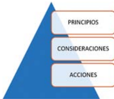
Gráfica 9. Marco responsabilidad social y medio ambiente