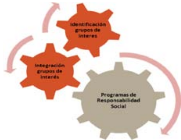
Gráfica 4. Tercera característica de la Responsabilidad Social