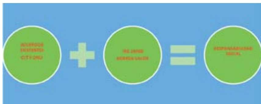
Gráfica 1. Visión inicial para ISO 26000