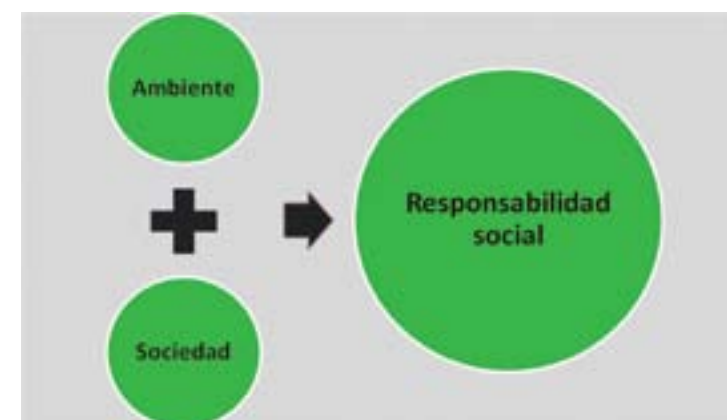
Gráfica 2. Primera característica de la Responsabilidad Social