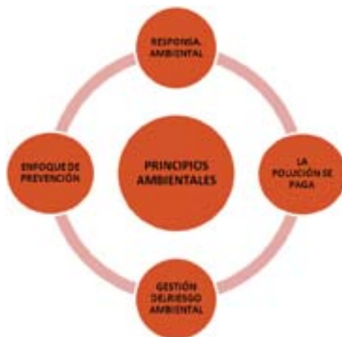
Gráfica 10. Principios ambientales

Fuente: elaboración propia, con fundamento en el proyecto de norma ISO 26000.