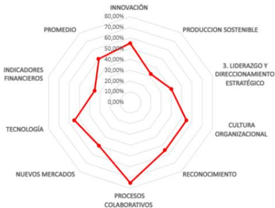
Ilustración 3 consolidados factores rise

Entre las fortalezas principales destacan: