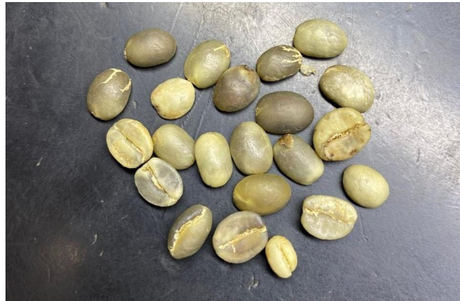
Ilustración 4. Defectos en los granos altos de humedad

Apreciamos un café con evidente presencia de humedad, disperejo, con alta cantidad de defectos, no apto para continuar hacia el proceso de trilla. En el caso hipotético de que decidiéramos recibir este café, con este alto porcentaje de humedad lo que obtendríamos sería un café deteriorado, con vetas producto de la alta actividad de agua dentro del grano además de granos aplastados por la característica blanda del mismo.