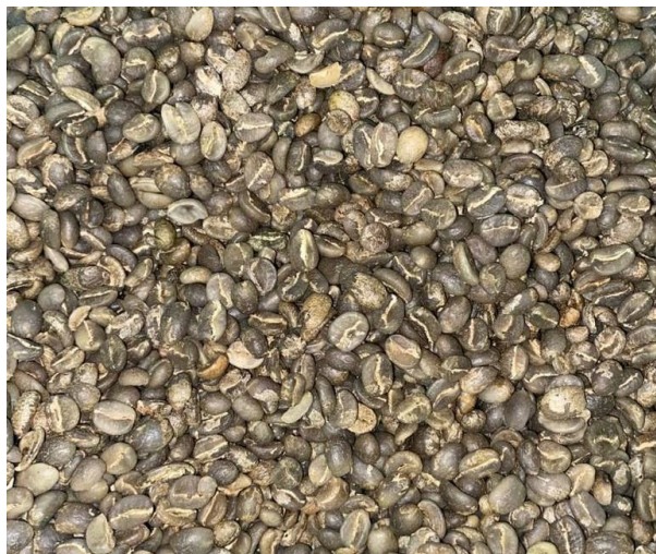
Ilustración 3. Aspecto café alto de humedad