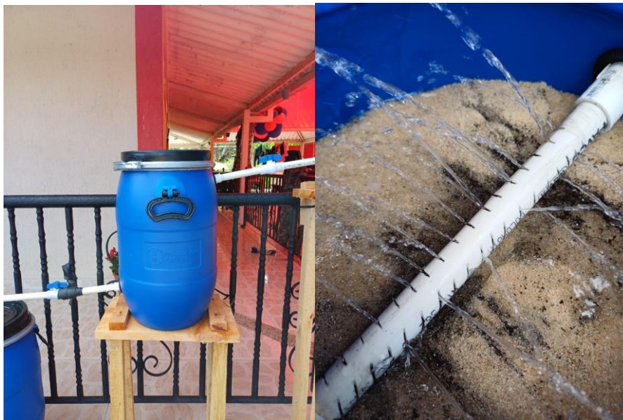
Figura 7. Proceso de filtración