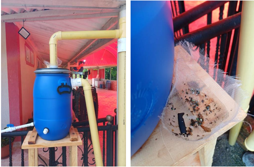
Figura 4. Solidos sedimentados en el fondo del tanque de almacenamiento