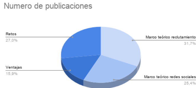
Figura 3. Contenido de temas de estudios primarios

la calidad para ser incluido en el análisis de los datos. De los cuales, los temas identificados en los estudios primarios destacan que el 32% son utilizados para marco teórico del reclutamiento, el 25% para marco teórico de redes sociales, los retos representan el 27% y las ventajas un 16%.