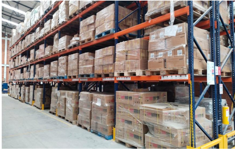
Figura 3 Material Zuncho en cajas