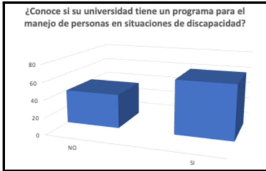
Figura 1. Conocimiento de los programas de la universidad para el manejo de personas en situación de discapacidad.