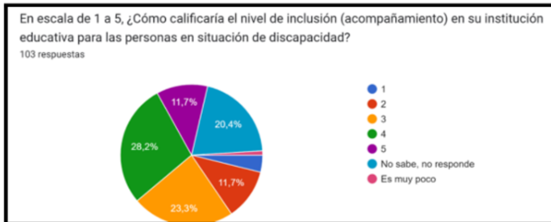
Figura 3. Nivel de Inclusión en las Universidades

Nota: En la presente figura se detalla, qué situación de discapacidad es la que más se observa en las universidades.