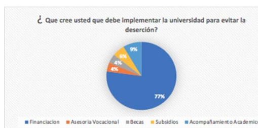
Gráfico 2: Elaboración Propia (2020), ¿Qué cree usted que debe implementar la universidad para evitar la deserción? Nota: la gráfica tipo pastel muestra algunas alternativas que puede tomar la universidad para evitar la deserción.

De acuerdo a la pregunta ¿cuál fue el último nivel escolar terminado por sus familiares?, para este caso de hermanos, lo encuestados contestaron que el 18% son bachilleres, el 37% posee un estudio de pregrado, el 28% posgrado, el 2% otro el cual puede ser maestría, doctorado entre otros, y el 15% indicaron que N/A, como análisis de esta pregunta se evidencia que el 37% y el 28% están en un rango de educación superior finalizada, se puede considerar que si son graduados, los ingresos recibidos por este segmento pueden beneficiar a los hermanos que actualmente estudian un pregrado, ya que ellos aportan económicamente y también impulsan al estudiante actual a finalizar sus estudios de educación superior.