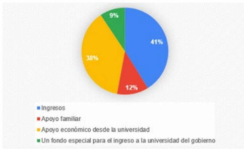
Gráfico 4 Elaboración Propia (2020), De 1 a 5 (donde 1 es poco o nada y 5 es mucho) ¿cuánto cree usted que los costos de la universidad se adapten a la realidad financiera de sus estudiantes? Nota: percepción de los costos universitarios frente a la realidad financiera de los estudiantes.

mucho) ¿cuánto cree usted que los costos de la universidad se adapten a la realidad financiera de sus estudiantes? Nota: percepción de los costos universitarios frente a la realidad financiera de los estudiantes.