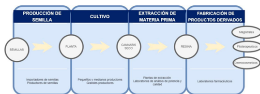
Fig 1. Cadena Productiva del Cannabis