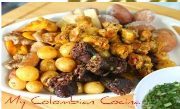
My Colombian Cocina